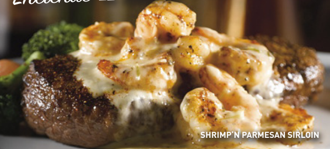
SHRIMP 'N PARMESAN SIRLOIN