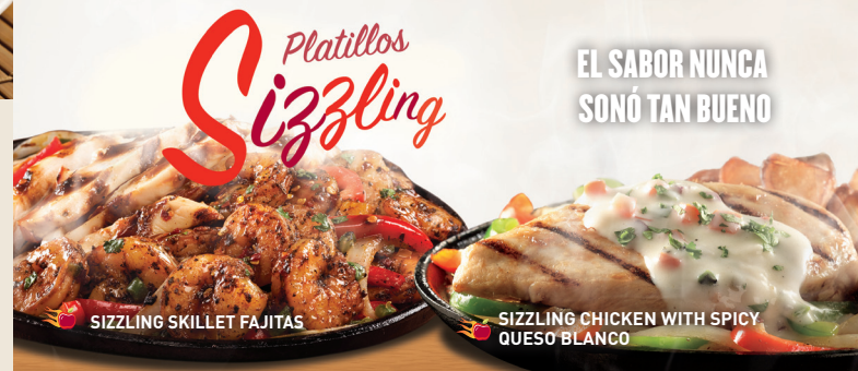
SIZZLING SKILLET FAJITAS

Costillitas de cerdo cocinadas lentamente y bañadas con salsa BBQ o si lo prefieres con salsa Southern BBQ o sweet & spicy. Servido con papas fritas y elote. $159