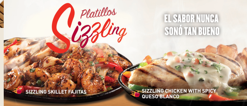
SIZZLING SKILLET FAJITAS

Costillitas de cerdo cocinadas lentamente y bañadas con salsa BBQ o si lo prefieres con salsa Southern BBQ o sweet & spicy. Servido con papas fritas y elote. $149