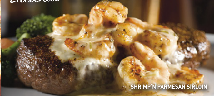
SHRIMP 'N PARMESAN SIRLOIN