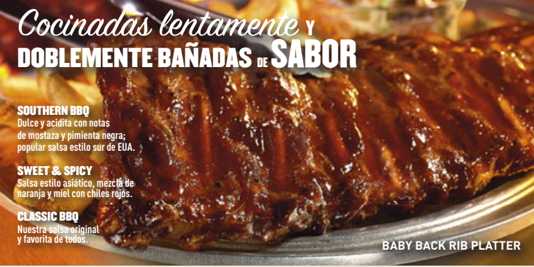
BABY BACK RIB PLATTER

Camarones bañados en una salsa Teriyaki sobre una cama de pasta penne integral. Mezclado con deliciosos vegetales y espolvoreados de fresco cilantro. Adornado con un gajo de limón para resaltar el sabor dulce y cítrico del Teriyaki. $119 Prueba también el Teriyaki Chicken Pasta. $109