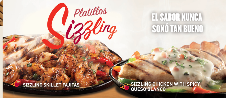
SIZZLING SKILLET FAJITAS

Costillitas de cerdo cocinadas lentamente y bañadas con salsa BBQ o si lo prefieres con salsa Southern BBQ o sweet & spicy. Servido con papas fritas y elote. $149