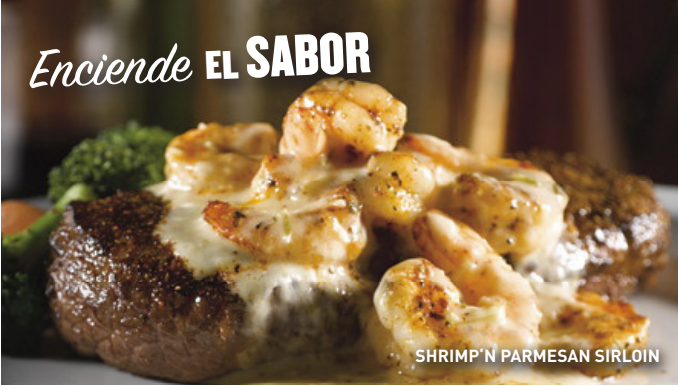
SHRIMP 'N PARMESAN SIRLOIN