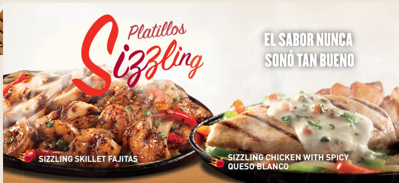
SIZZLING SKILLET FAJITAS