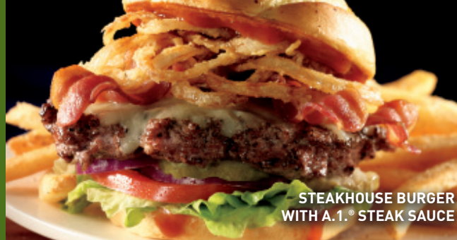
STEAKHOUSE BURGER WITH A.1.® STEAK SAUCE