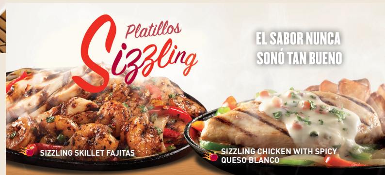
SIZZLING SKILLET FAJITAS

Costillitas de cerdo cocinadas lentamente y bañadas con salsa BBQ o si lo prefieres con salsa Southern BBQ o sweet & spicy. Servido con papas fritas y elote. $149