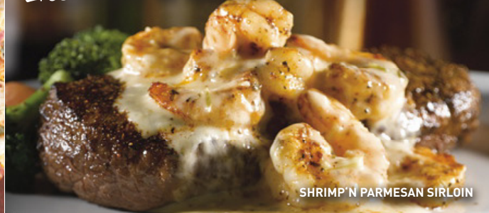
SHRIMP 'N PARMESAN SIRLOIN