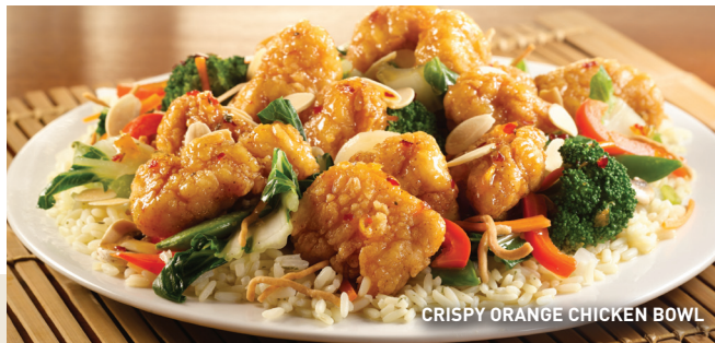
CRISPY ORANGE CHICKEN BOWL

Ligera combinación de lechugas, tomate picado, pepino en cubos, queso Jack Cheddar rallado, tocino picado, crotones y aderezo al gusto. $74