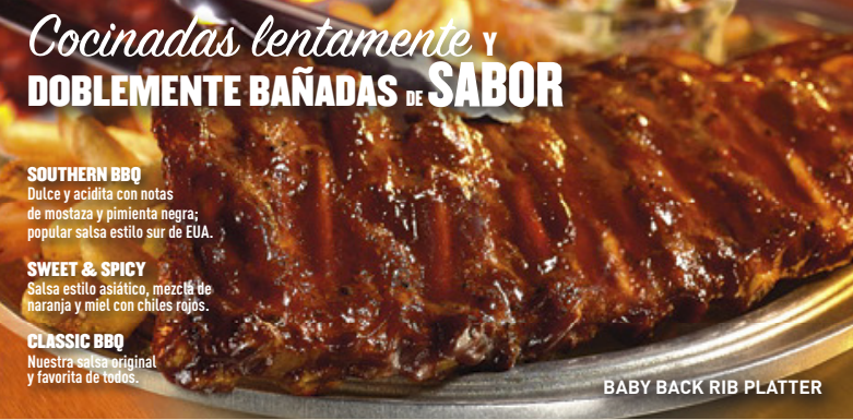
BABY BACK RIB PLATTER

Camarones bañados en una salsa Teriyaki sobre una cama de pasta penne integral. Mezclado con deliciosos vegetales y espolvoreados de fresco cilantro. Adornado con un gajo de limón para resaltar el sabor dulce y cítrico del Teriyaki. $119 Prueba también el Teriyaki Chicken Pasta. $109