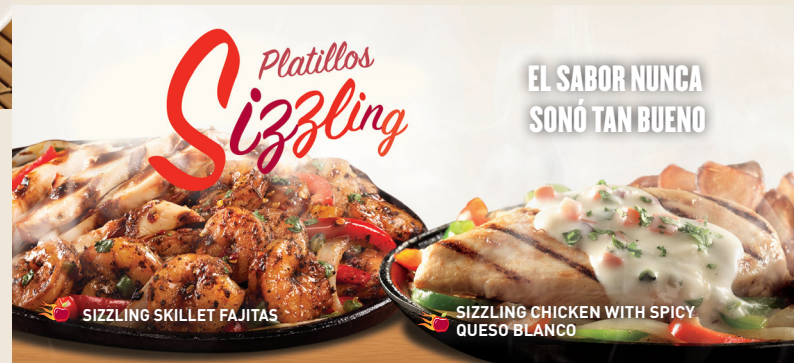
SIZZLING SKILLET FAJITAS

Costillitas de cerdo cocinadas lentamente y bañadas con salsa BBQ o si lo prefieres con salsa Southern BBQ o sweet & spicy. Servido con papas fritas y elote. $149