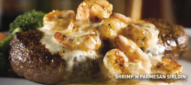
SHRIMP 'N PARMESAN SIRLOIN