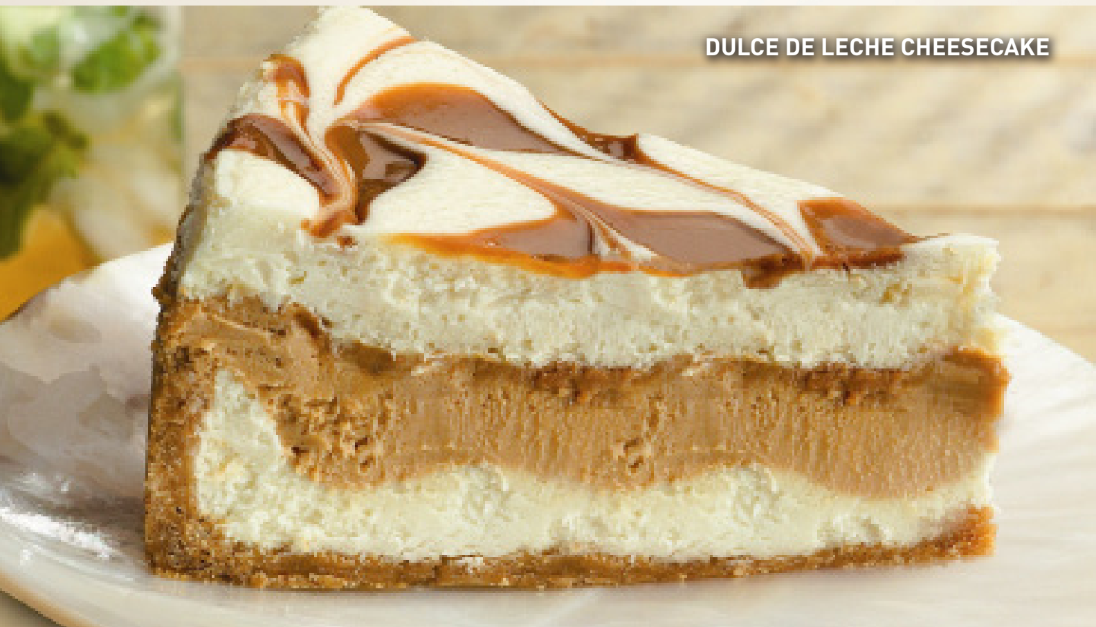
DULCE DE LECHE CHEESECAKE

¡Una fiesta de sabores! Delicioso cheesecake de chocolate blanco mezclado con caramelo y cubierto de dulce de leche.