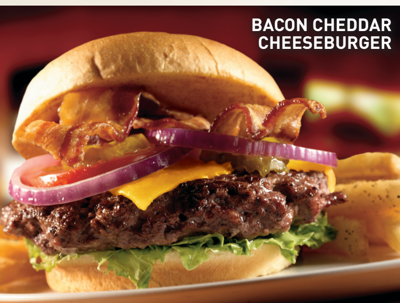
BACON CHEDDAR CHEESEBURGER

Applebee's le da un giro a un clásico de Estados Unidos... esta hamburguesa está apilada con cebollas asadas, pimientos y champiñones salteados, cubiertos en una salsa cremosa de queso blanco americano y queso blanco Cheddar. Servido en un pan hoagie tostado.