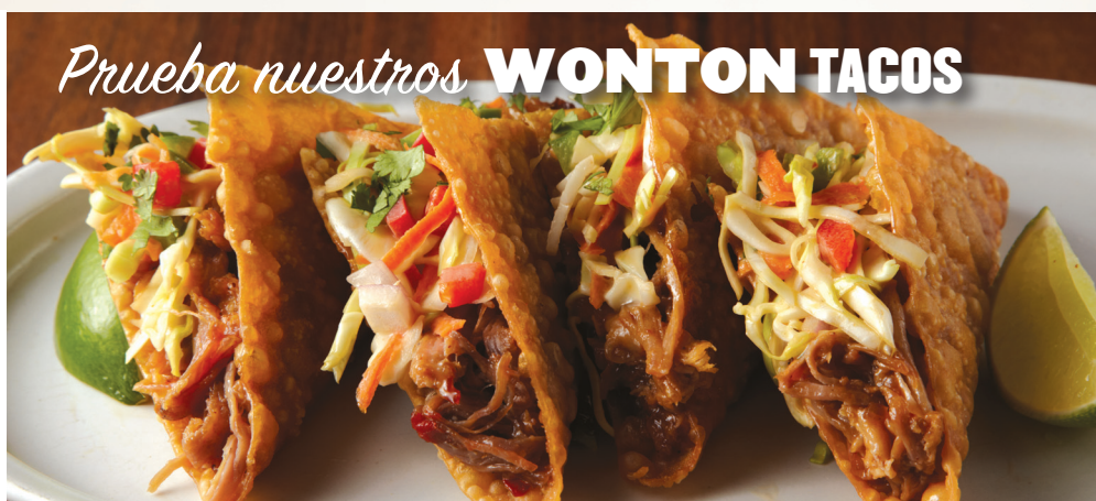
Prueba nuestros WONTON TACOS