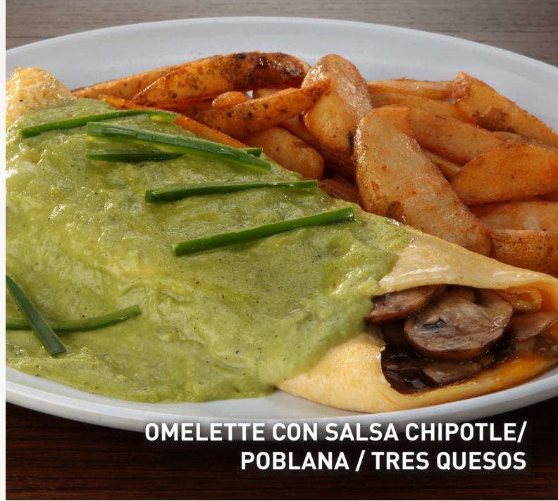
OMELETTE CON SALSA CHIPOTLE/ POBLANA / TRES QUESOS

Una sartén caliente repleto de huevos revueltos, papas fritas, champiñones, cebollas y pimientos salteados, gratinados con queso cheddar y tu elección de tocino o salchichas.