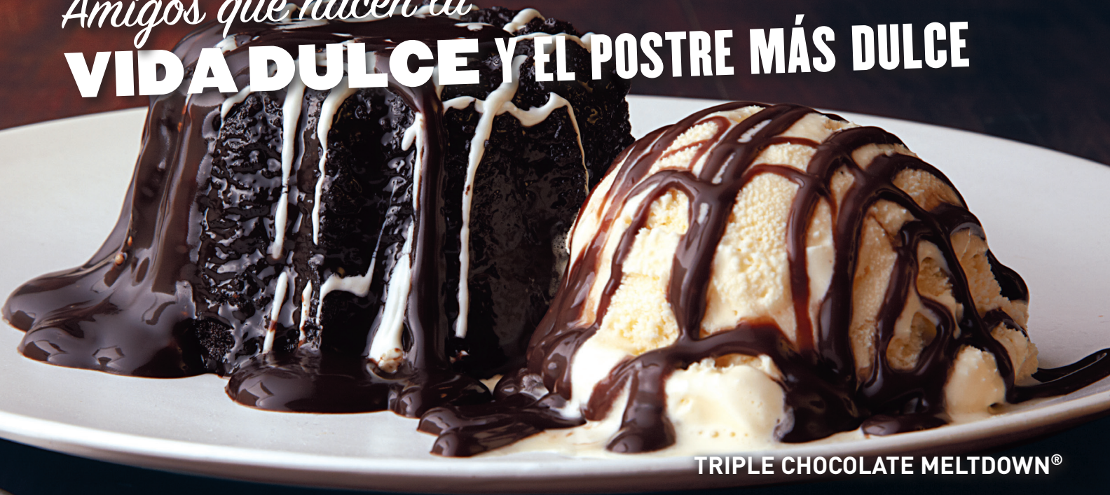
TRIPLE CHOCOLATE MELTDOWN®

Amigos que hacen la VIDA DULCE Y EL POSTRE MÁS DULCE