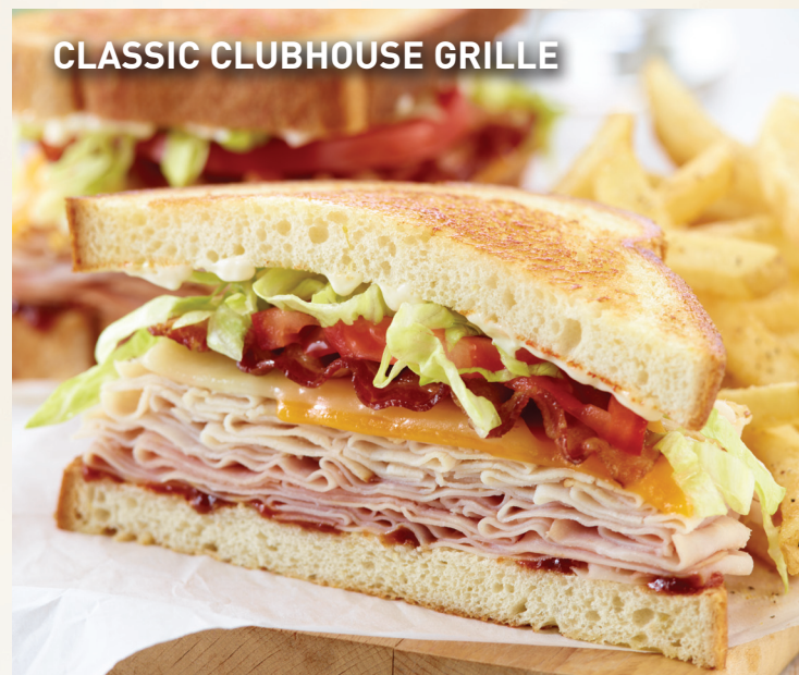
CLASSIC CLUBHOUSE GRILLE

Servido sobre nuestro delicioso pan tostado su sabor será un clásico. Servido con jamón ahumado, pavo, queso Cheddar y queso Jack derretido, tocino ahumado y los ingredientes más frescos: lechuga, tomate, mayonesa y con un toque final de nuestra salsa BBQ.