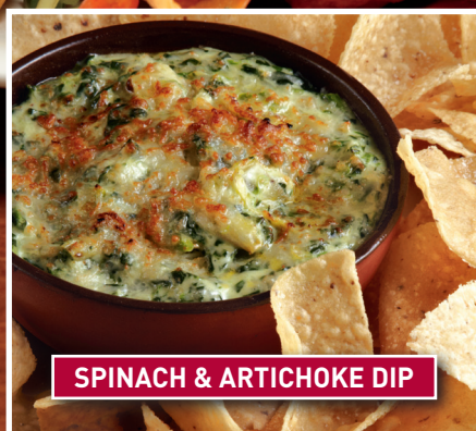
SPINACH & ARTICHOKE DIP