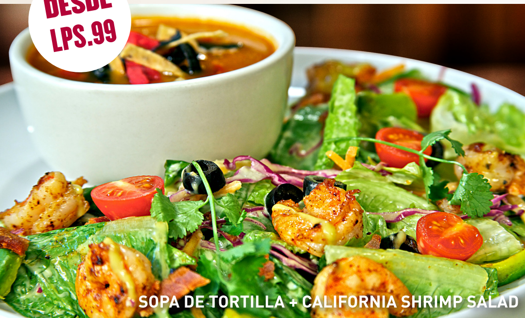
SOPA DE TORTILLA + CALIFORNIA SHRIMP SALAD