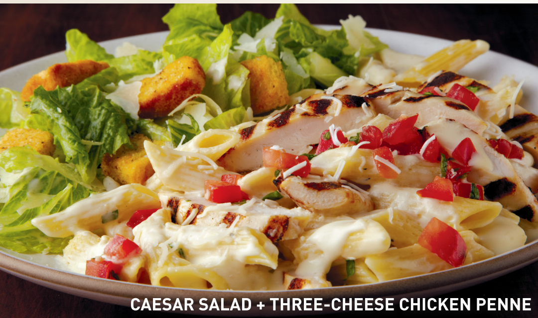
CAESAR SALAD + THREE-CHEESE CHICKEN PENNE