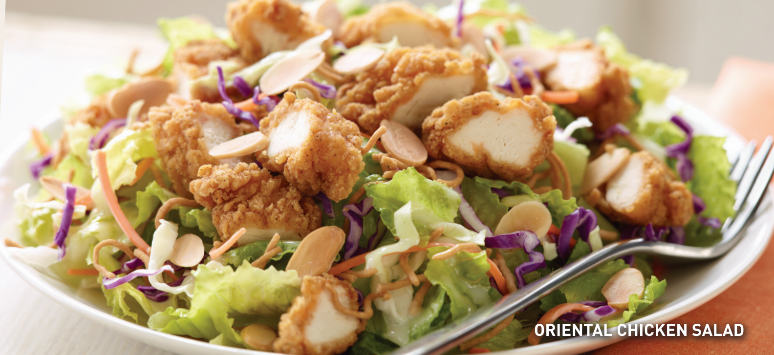
ORIENTAL CHICKEN SALAD