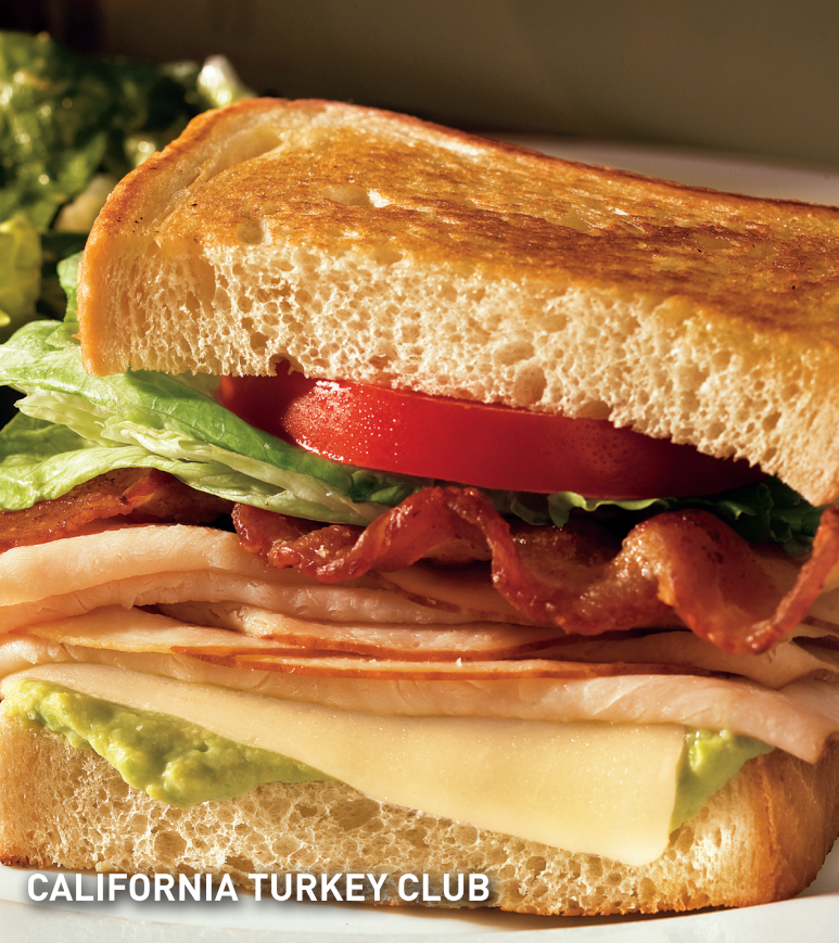
CALIFORNIA TURKEY CLUB