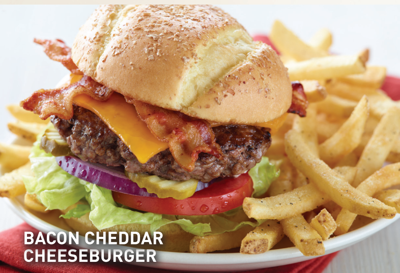
BACON CHEDDAR CHEESEBURGER

Applebee's le da un giro a un clásico de Estados Unidos... esta hamburguesa está apilada con cebollas asadas, pimientos y champiñones salteados, cubiertos en una salsa cremosa de queso blanco americano y queso blanco Cheddar. Servido en un pan hoagie tostado. Lps.199