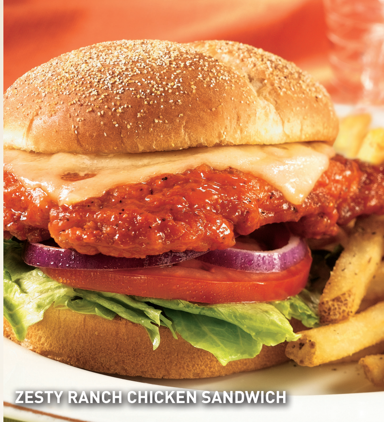
ZESTY RANCH CHICKEN SANDWICH