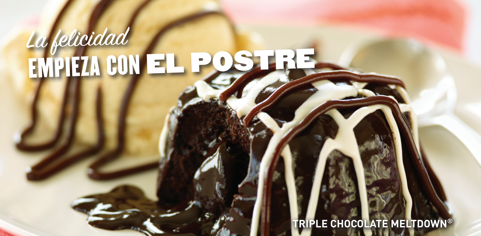
TRIPLE CHOCOLATE MELTDOWN®