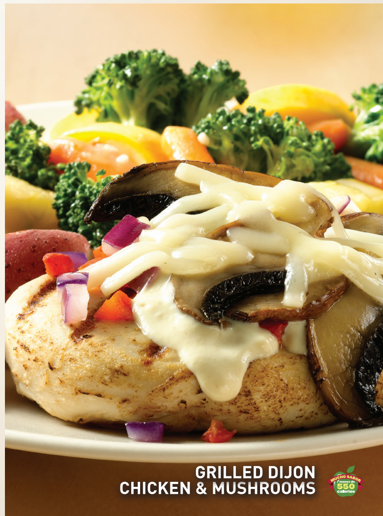
GRILLED DIJON CHICKEN & MUSHROOMS

Mezcla estilo oriental preparada con crujientes cubitos de pollo empanizados, bañada con nuestra exclusiva Salsa Oriental a la Naranja. Servida sobre una cama de arroz pilaf y una mezcla de vegetales. Acompañado con tallarines de arroz tostado y almendras tostadas. Lps.219