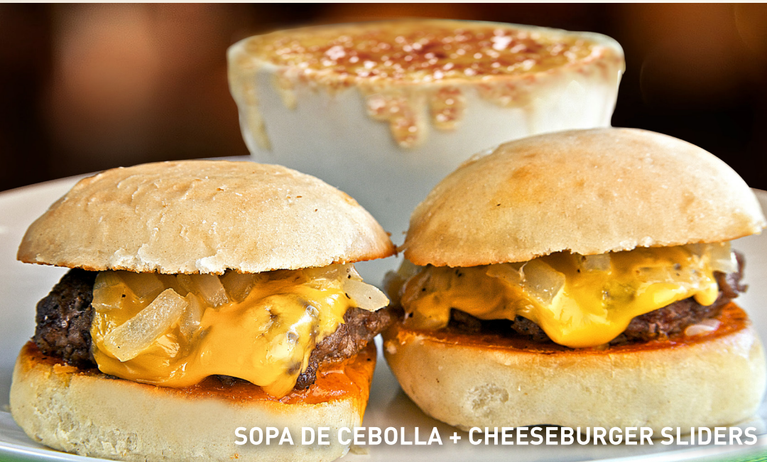
SOPA DE CEBOLLA + CHEESEBURGER SLIDERS