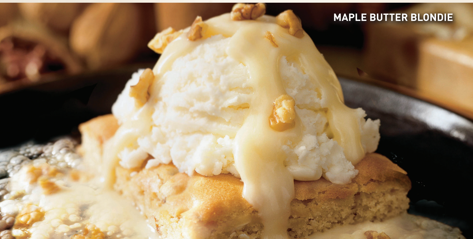
MAPLE BUTTER BLONDIE

©OREO is a registered trademark of Kraft Foods.