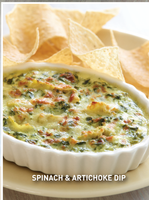
SPINACH & ARTICHOKE DIP