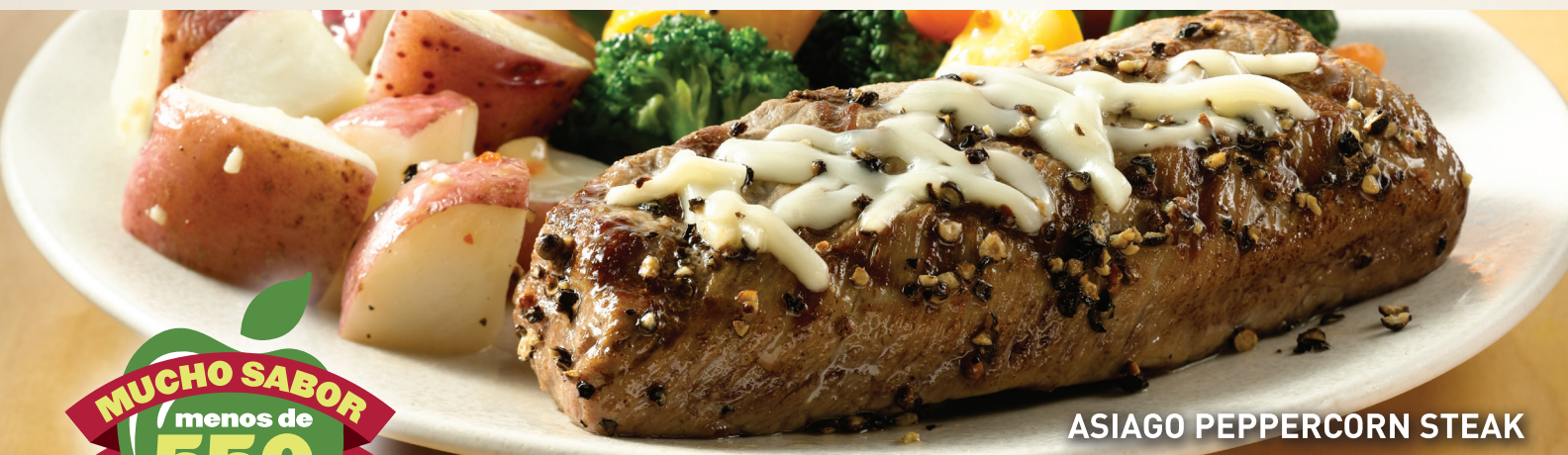
ASIAGO PEPPERCORN STEAK

A nuestros clientes con alergias y sensibilidad a alimentos: Applebee's® no puede asegurar que los platillos no contengan ingredientes que puedan causar una reacción alérgica. Por favor, tómallo en cuenta antes de ordenar.