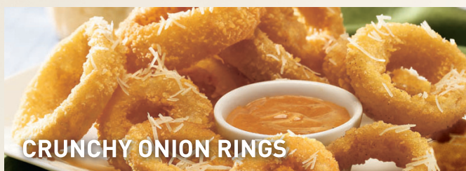
CRUNCHY ONION RINGS

Gruesas rebanadas de cebolla empanizadas y muy doraditas. Lps.119