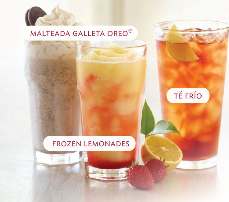
MALTEADA GALLETA OREO®

Un toque deliciosamente picante. Prueba nuestras chips de tortilla especialmente hechas para ti, acompañadas de una salsa estilo chipotle. → Lps. 38