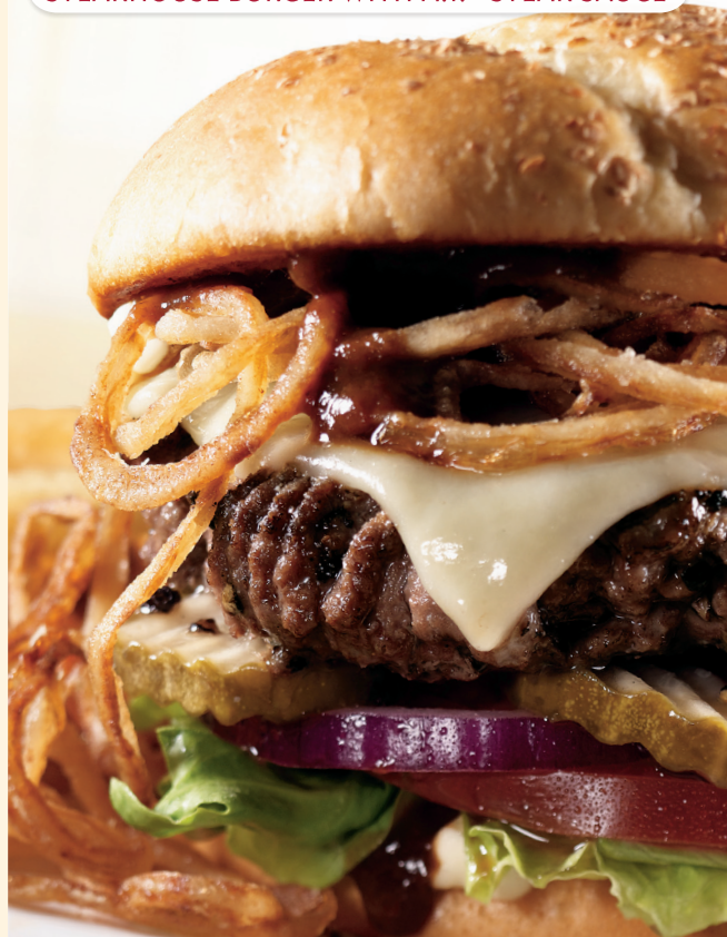
STEAKHOUSE BURGER WITH A.1. ® STEAK SAUCE

Pídela a tu gusto, cheeseburger o bacon cheeseburger acompañada con papas fritas. Se sirve con lechuga, tomate, pepinillos y cebolla. → Lps. 179