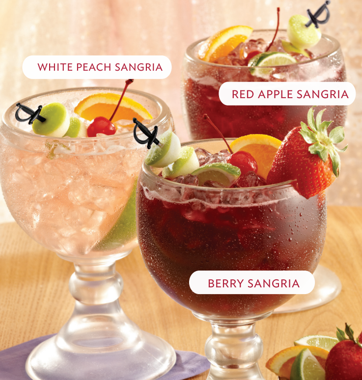
WHITE PEACH SANGRIA