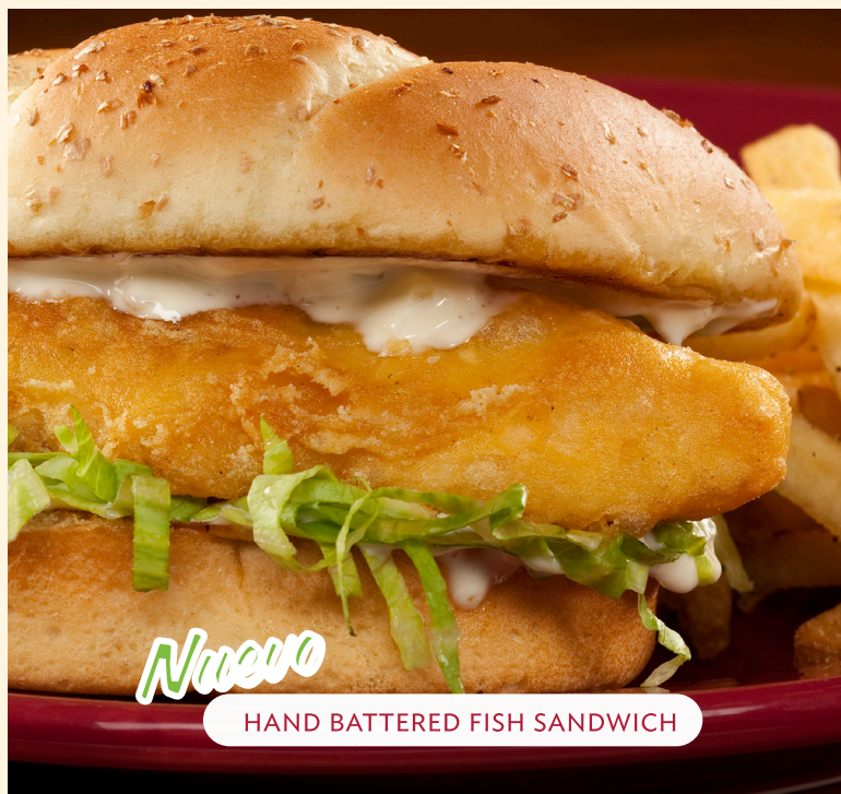
HAND BATTERED FISH SANDWICH