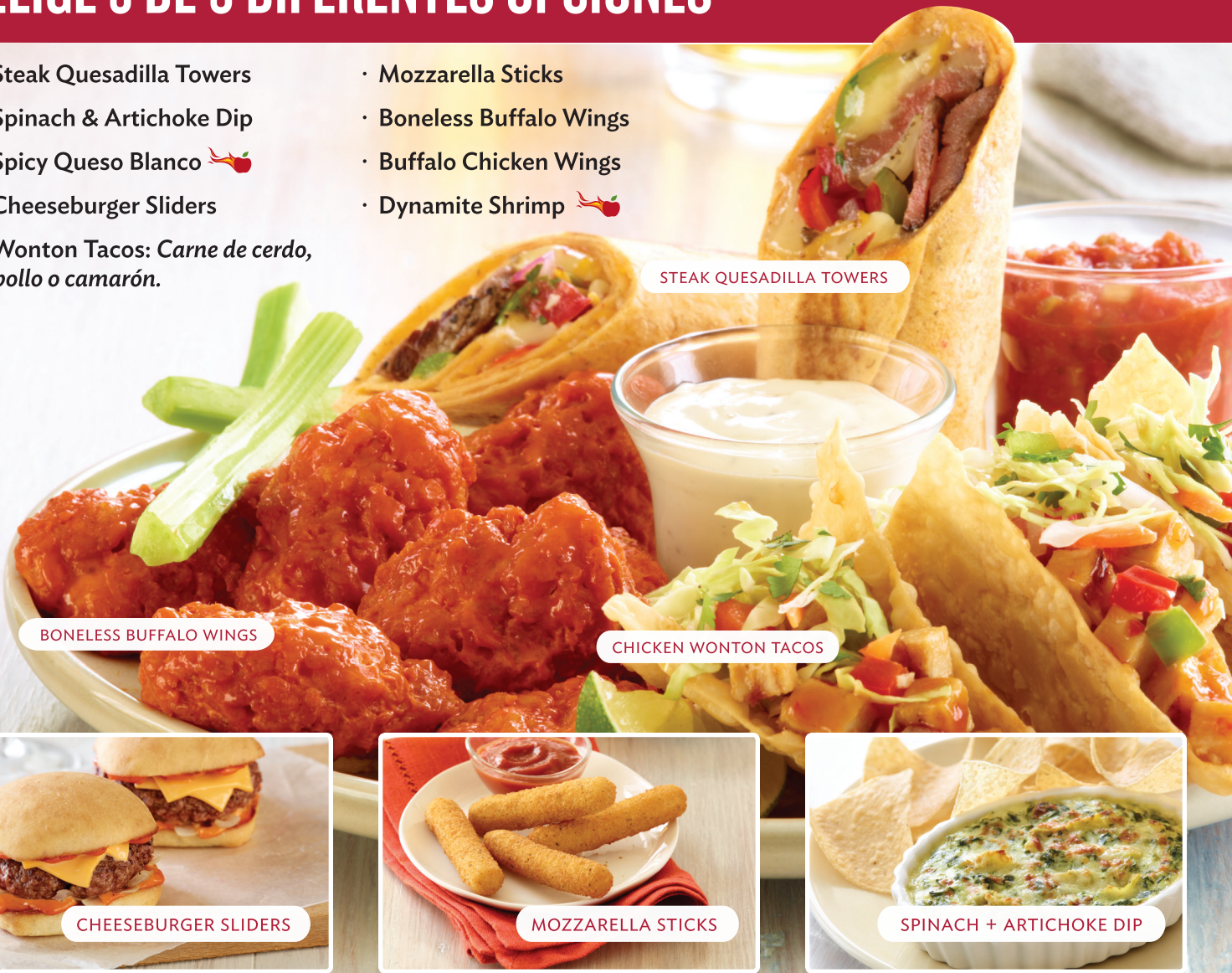
STEAK QUESADILLA TOWERS