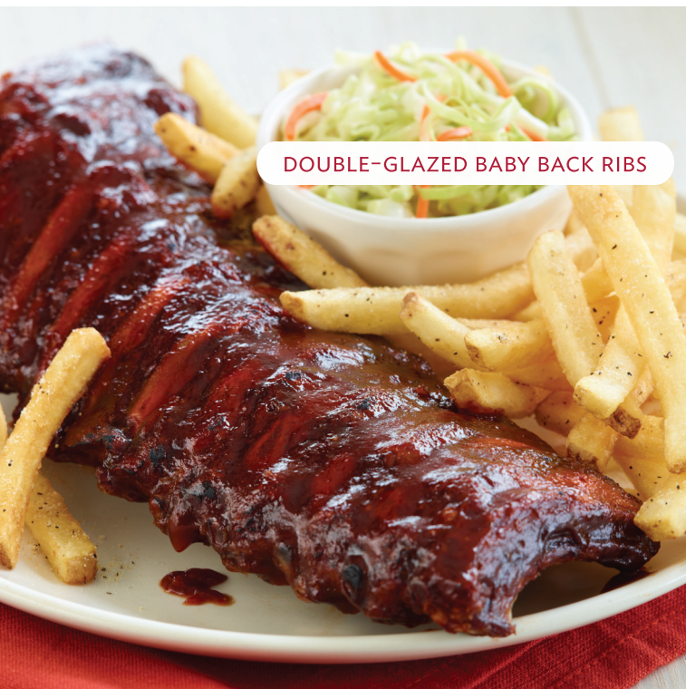
DOUBLE-GLAZED BABY BACK RIBS