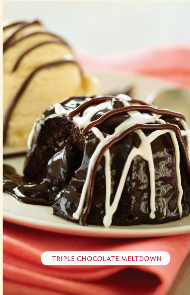
TRIPLE CHOCOLATE MELTDOWN

Delicioso brownie con trozos de chocolate negro, nueces y chocolate caliente. Acompañado de helado de vainilla. → Lps. 89