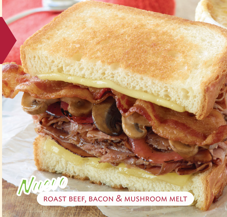
ROAST BEEF, BACON & MUSHROOM MELT

TODOS LOS SÁNDWICHES INCLUYEN PAPAS FRITAS.