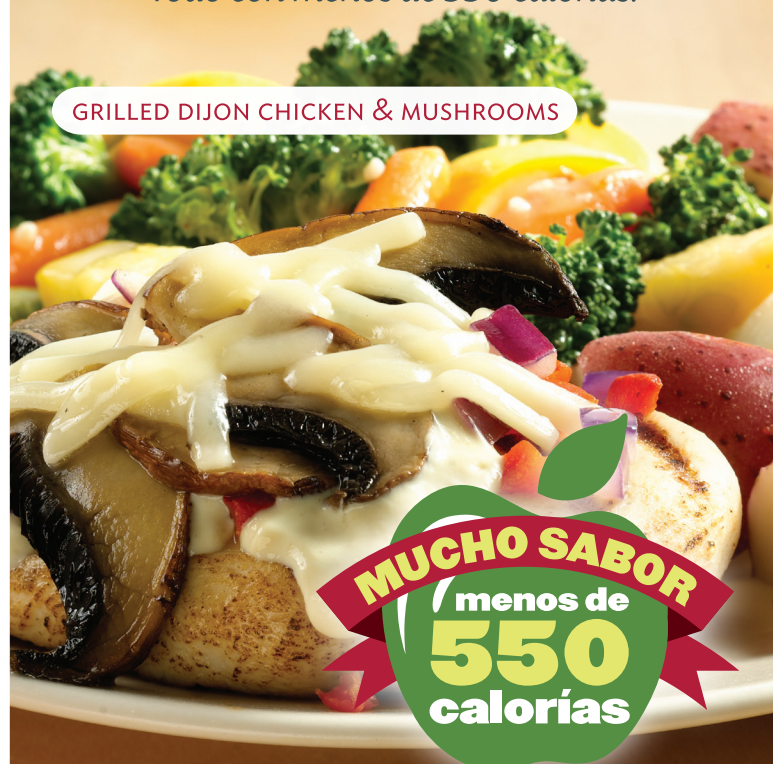
GRILLED DIJON CHICKEN & MUSHROOMS